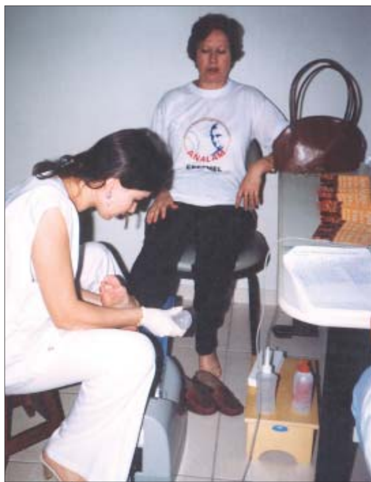
Servidora faz teste gratuito para detectar osteoporose e